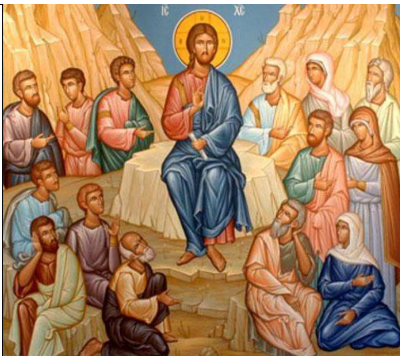
Predica de pe munte, frescă

Nu e cu totul limpede nici cum se poate ajunge la ea; tocmai de aceea Mântuitorul adaugă la această poruncă reguli lămuritoare: "Ca pe tine însuși; și precum voiți să vă faceți vouă oamenii, faceți-le și voi asemenea". Aici ni se arată măsura dragostei, care este, s-ar putea spune, lipsită de măsură; căci are oare dragostea, în sine, vreo măsură și este vreun lucru bun pe care omul nu și-ar dori să îl primească de la ceilalți?