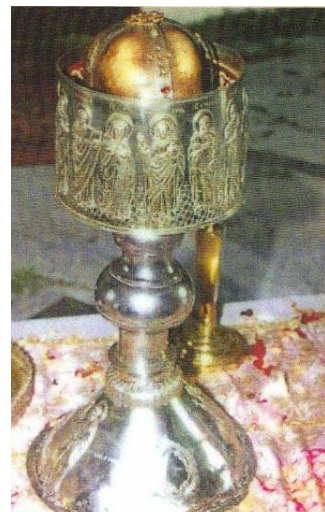
Capul Sf. Aposol Toma, foto

Acestea sunt păstrate într-o raclă din argint.