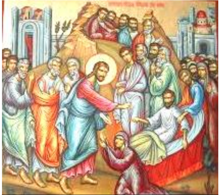
Învierea fiului văduvei din Naini, frescă

Sunt unele obiceiuri născute din patimi și născocite spre îndestularea lor: altele sunt hrănite doar de deșertăciune.