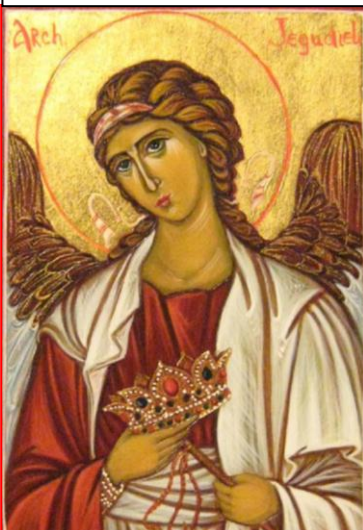
Sf.Arhanghel Egudiil, icoană

Îngerii se îndepărtează de noi — mă înfricoșează să folosesc cuvântul a părăsi. Vai de noi când ne părăsește îngerul nostru păzitor! El se îndepărtează atunci când nu mai poate suporta mizeria și păcatele din viața noastră trupească și sufletească. Din pricina libertății prost înțelese, ne croim viața cu propriile noastre mâini și atunci îngerul este izgonit din lucrarea cea adevărată și suntem lăsați liberi să ne manifestăm.