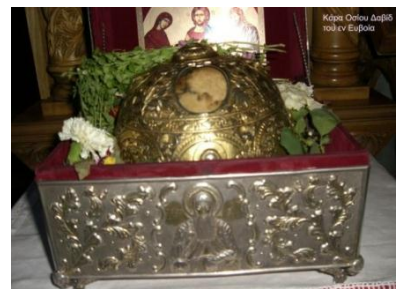
Sfintele moaște ale Cuv. David, foto