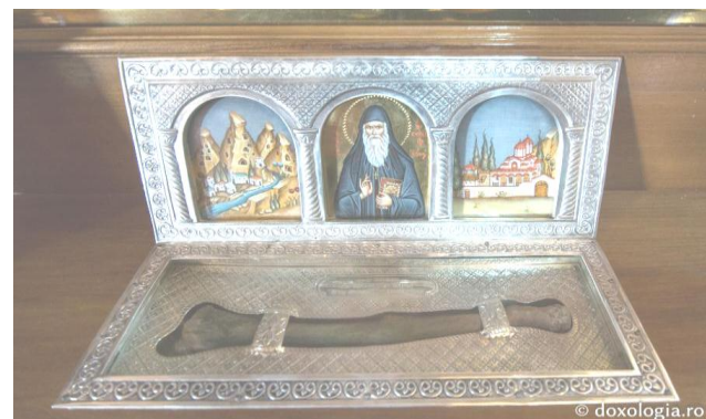
Moștele Sf. Arsenie Capadocianul se află în biserica cu hramul Sfântului de la Suroti, foto

Viață plăcută lui Dumnezeu petrecând și vas cinstit Mângâietorului făcându-te, purtătorule de Dumnezeu Arsenie, te-ai arătat și primitor al darului facerii de minuni, tuturor dându-le grabnic ajutor, Părinte Cuvioase, pe Hristos Dumnezeu roagă-L să ne dăruiască nouă mare milă.