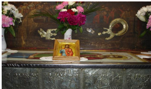
Moaștele Sf. Ioan cel Nou de la Suceava, foto

(Sfântul Ioan Gură de Aur, Întru lauda Sfinților mucenici , Editura Ars Longa)