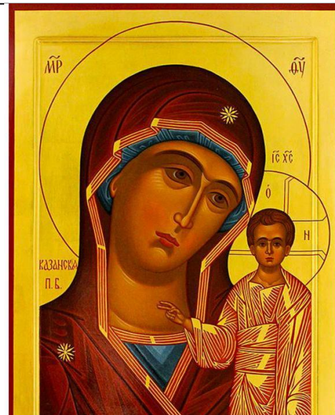
Icoana Maicii Domnului din Kazan

Sfântul Teofan Zăvorâtul primea zilnic aproape 40 de scrisori, din partea credincioșilor care doreau să aibă parte de sfatul său în diverse probleme de viață. El a scris răspunsuri pentru fiecare scrisoare în parte, cu multă atenție și dragoste.