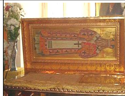
Moaștele Sf. Teofan Zăvorâtul, foto