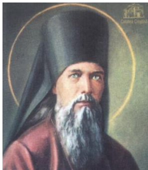
Sfântul Teofan Zăvorâtul (1815 – †1891)

❖ "Domnul dăruiește harul, dar El vrea ca omul să Îl caute și să dorească a-L primi, închinându-se cu toate ale sale lui Dumnezeu."