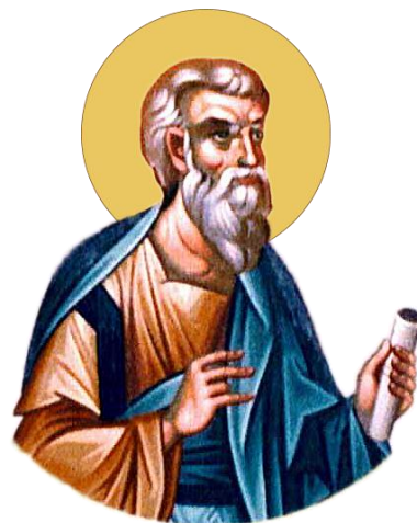
Sfântul Apostol Arhip, icoană

(Canon de rugăciune către Sfântul Apostol Arhip)