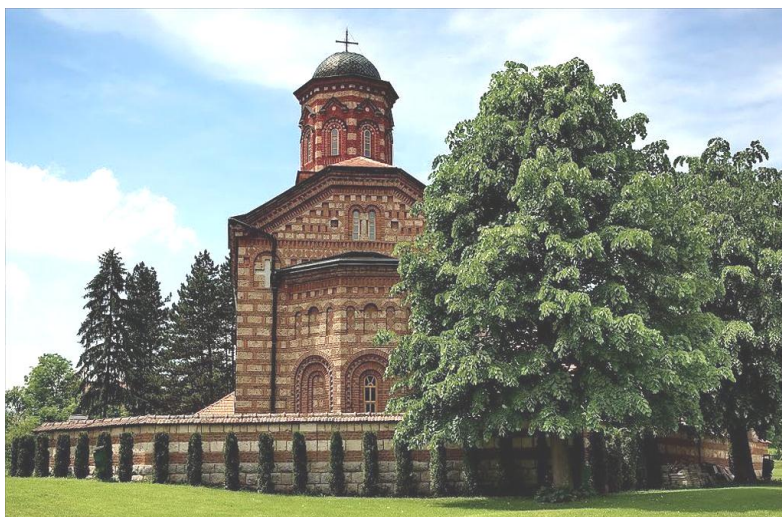
Mănăstirea Lelic – Lelici , foto

Mănăstirea Lelic – Lelici – este o mănăstire ortodoxă aflată în localitatea Lelic, așezată la mică distanță de Valievo, Serbia. Mănăstirea se află pe culmea muntelui Povlen, deasupra defileului Gradac, la numai 10 kilometri de Valievo și la doar câțiva kilometri de Mănăstirea Celije. Din capitala țării, Belgrad, și până aici se fac în jur de două ore. Biserica din Lelic a fost construită în anul 1929, de către Sfântul ierarh Nicolae Velimirovici.