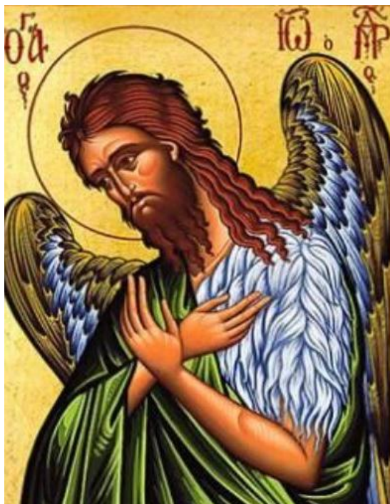
Sfântul Ioan Botezătorul, icoană

Celălalt monah a fost de acord și au început paraclisul. Copilul a fost cuprins de neliniște și a început să se tăvălească pe plăcile de piatră ale bisericii. Ciobanul devenise alb ca varul și inima i se zdrobise