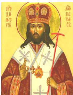
Sf. Dimitrie de Rostov, icoană

Nu-ți alipi ochii de fețe frumoase, pentru că inima ta să nu fie înrobită de frumusețea stricăcioasă și să se depărteze de Dumnezeu. Nu primi și nu te supune cugetelor desfrânate, ca să nu cazi din iubirea lui Dumnezeu. Nu-i invidia pe cei care fac asemenea lucruri, despre care „rușine este chiar a le spune” (Efeseni 5,2).