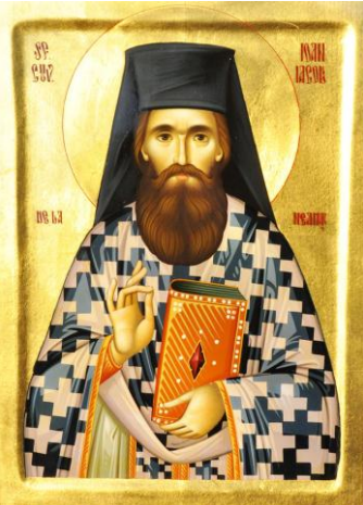
Sfântul Ioan Iacob de la Neamț ( 1913-1960 )

Pe tine, Părinte, te cinstim, căci lăsând lumea și patria ta, ai luat Crucea, urmând lui Hristos și în valea Iordanului, în peșteră pustnicească, la Hozeva, nevoindu-te, te-ai mutat la Cel dorit. Pentru aceasta, împreună cu îngerii se bucură, Prea Cuvioase Ioane, duhul tău.