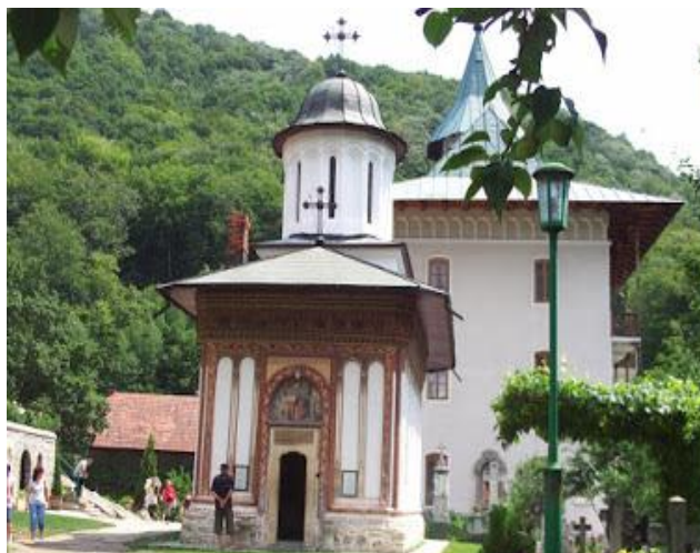
Biserica Mănăstirii Turnu, foto

La începutul secolului al XVII-lea Cuviosul Daniil Pustnicul a ieșit din mănăstire cu binecuvântarea starețului său și a trecut peste Olt, oprindu-se sub muntele Cozia.