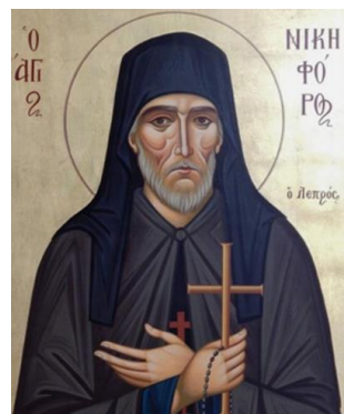
Sf. Nichifor Leprosul, icoană