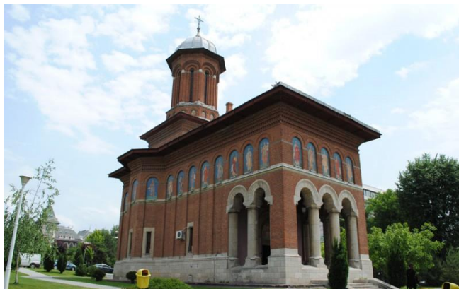
Biserica Sfânta Treime din Craiova, foto

Într-adevăr, când se va da o definiție a fiecăreia din aceste numiri și a naturii însăși care designează aceste denumiri, se va da aceeași definiție a acestora și a aceleia. Or, lucrările a căror definiție e contrară vor avea și ele o natură diferită. Deci altceva e substanța sau ființa, pentru care nu s-a aflat termenul în stare să o facă cunoscută, și altceva e și semnificația numirilor pe care le poartă și care li se dă pe temeiul unei activități ori a unei