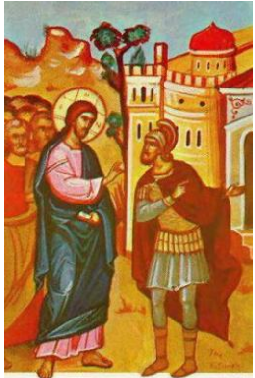
"Vindecarea slugii sutașului", frescă

(Sfântul Ioan Gură de Aur, Omilii la Evanghelia după Matei 26, 1)