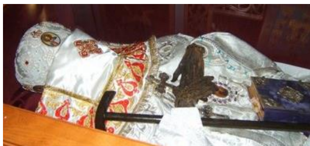
Moaștele Sf. Ierarh Ioan Maximóvici se află în baldachinul din Catedrala ortodoxă din San Francisco

El i-a luat mâinile într-ale sale și i le-a