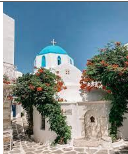
Biserica cu hramul "Schimbarea la Față a Domnului" din Paros, foto

(Filotei Zervakos, Sfaturi, minuni, rugăciuni, traducere din limba greacă de Preot Șerban Tica)