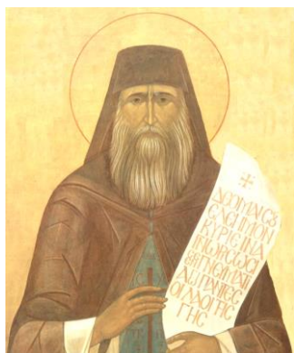
Sf. Siluan Athonitul, icoană

"Noi credem că adevărata libertate este a nu păcătui, a iubi din toată inima și din toate puterile pe Dumnezeu și pe aproapele."