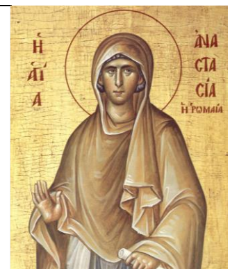
Sf. Anastasia, icoană

Doctorii și-au ridicat mâinile în aer, spunând că acest caz este foarte greu de operat.