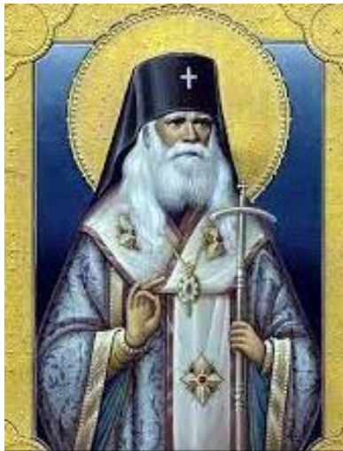
Sfântul Ierarh Serafim Sobolev (1881 -†1950), icoană

Domnul s-a botezat pentru ca să pună început botezului nostru. În timpul dumnezeiescului Botez, Duhul Sfânt s-a pogorât în chip văzut asupra lui Hristos, Domnul Nostru, Care a venit pe pământ pentru a-L putea trimite mai apoi, pe Acest Sfânt Duh neamului omenesc. Trimiterea Harului Sfântului Duh, precum învață Domnul Însuși (Ioan 16, 7), apostolii Lui și Sfinții Părinți ai Bisericii, a fost scopul venirii Lui în lume, al pătimirii și morții Lui pe Cruce.