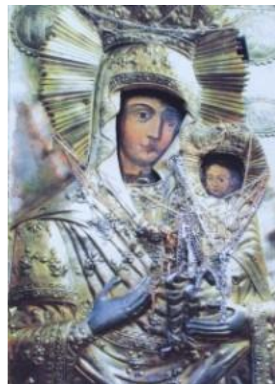
Icoana Maicii Domnului de la Giurgeni

(Text apărut pe site-ul Mănăstirii Giurgeni)