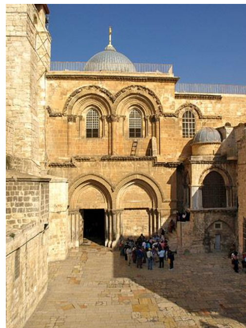
Curtea și intrarea Bisericii Învierii din Ierusalim, foto