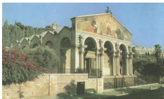
Biserica națiunilor din Ierusalim, foto