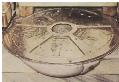
Disc de aur marcând locul Crucii pe Golgota, dăruit de Șerban Cantacuzino, domnul Țării Românești (1678-1688). Se păstrează în biserica Sfântului Mormânt, capela Calvarului, foto .