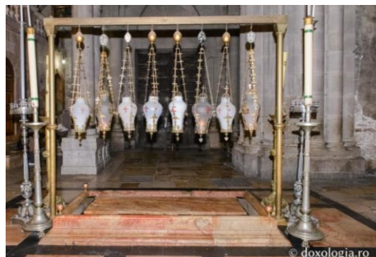
Piatra ungerii, foto