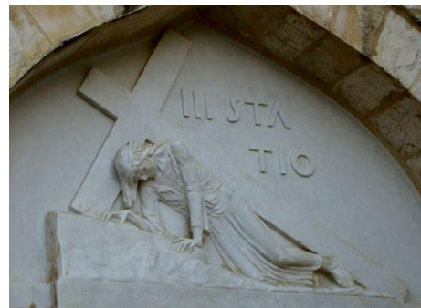
Stația a treia marchează prima cădere a Mântuitorului sub greutatea crucii, foto

Acest vestibul se numește "Capela Îngerului", pentru că în ziua învierii îngerul Domnului, așezat pe piatra răsturnată, a vestit sfintelor femei "El a înviat"!