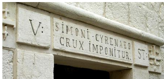
Stația a 5-a, locul în care Simon Cireneul a luat crucea Domnului Iisus, foto