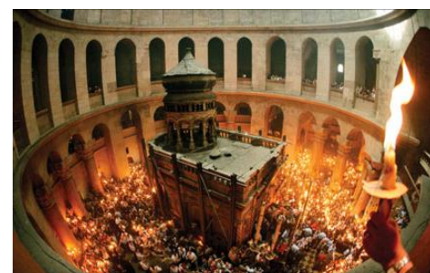
Venirea Sfântei Lumini în Ierusalim în 2002, foto