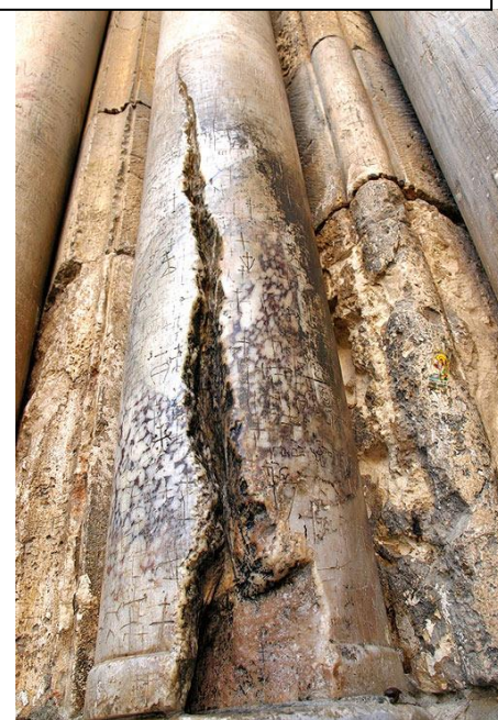
Coloana despicată de Sfânta Lumină în 1579, foto

(Text publicat în "Vestitorul Ortodoxiei Românești", periodic al Patriarhiei Române din 15 februarie - 1 martie 1990, nr. 4-3, anul II)