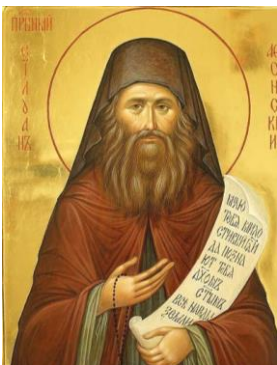
Sfântul Silvan Athonitul, Icoană