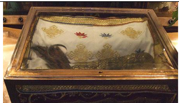
Chivot cu mâna dreaptă a Sf.Ciprian, foto