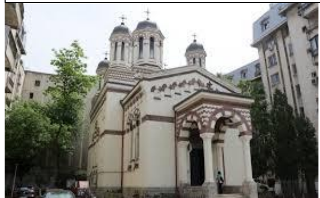
Biserica Zlătari din București foto.