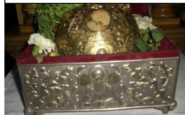
Sfintele moaște ale Cuviosului David, foto

Scoate-ne și pe noi, Fericite, din desișul patimilor și ne du, rugămu-ne ție, la limanul cel neînvăluit al mântuirii. (Troparul Sf. Cuv. David)