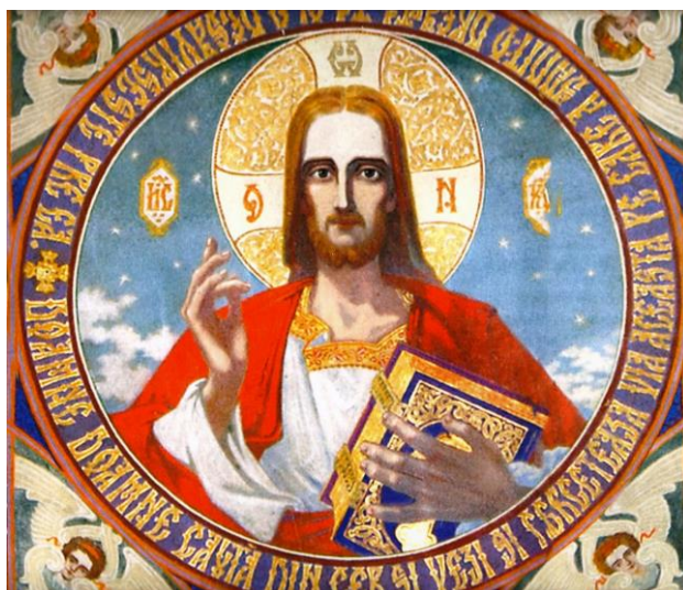
Iisus Hristos – Pantocrator, frescă realizată de Cuviosul Arsenie Boca la biserica Drăgănescu.

Tot astfel și sufletul nostru strigă către Dumnezeu din pricina durerii pe