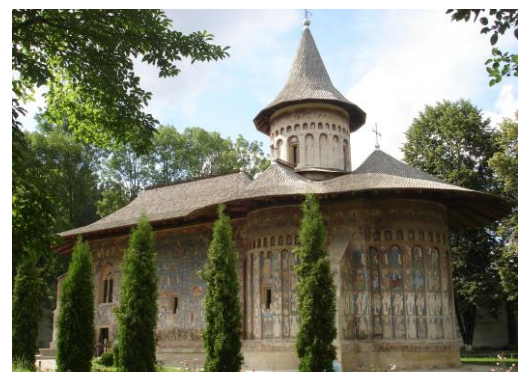
Biserica Mănăstirii Voroneț, foto

Chilia de piatră a Sf. Cuvios Daniil Sihastrul, de la Putna se află nu departe de locul unde se varsă pârauul Vițeu în pârau Putna; cealaltă, din valea Voronețului, se află sub stâncă Șoimului.