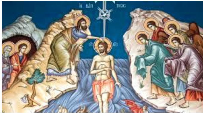
Botezul Domnului, frescă

(Troparul înainte-prăznuirii Botezului Domnului, glasul al 4-lea)