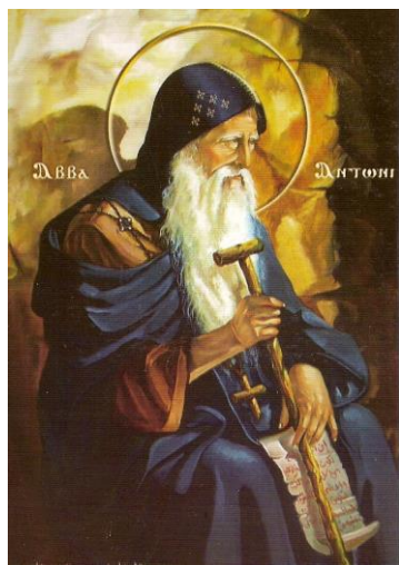
Sf. Antonie cel Mare, icoană

Deci, dacă noi nu ne lepădăm de lume și nu răbdăm ca el, (ca Sf. Antonie), cum ne vom învrednici să vedem pe Dumnezeu și să ne umplem de bucurie ?