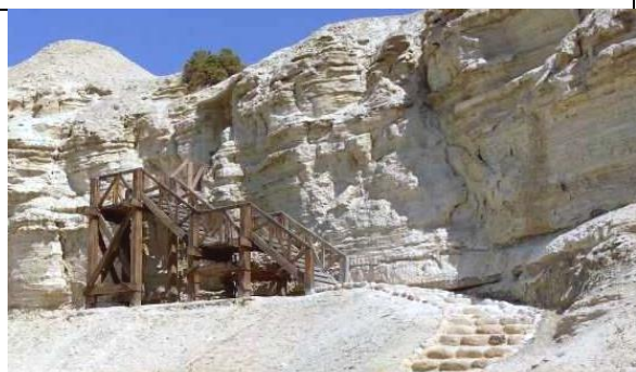
Muntele unde se află Peștera Sfintei Maria Egipteanca, și Peștera (interior), foto.

Așezată într-o zonă deșertică, cu aer uscat și fierbinte, peștera oferă o perspectivă amplă asupra văii Iordanului. ( www.doxologie.ro )