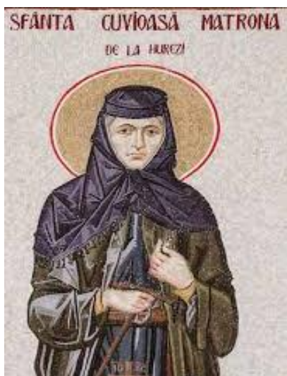
Sf. Cuvioasă Matrona de la Hurezi, frescă