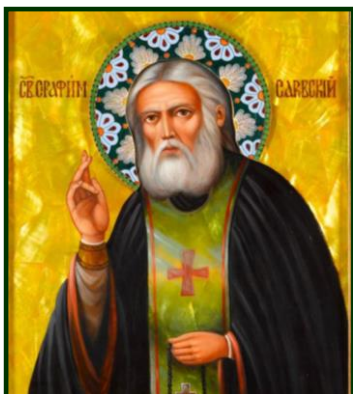
Sf. Serafim de Sarov, icoană

„Istovește-ți trupul cu postul și cu privegherea, și vei alunga gândul chinuitor al iubirii de plăceri.”