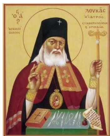
Sf. Ier. Luca al Crimeei, icoană

„Ce este postul duhovnicesc? Este înfrânarea de la tot ce ne vătămă, de la tot ce strică sufletul nostru, adică de la patimi, ce stau la temelia tuturor păcatelor noastre. Sfinții Părinți deosebeau opt patimi de căpetenie: lăcomia pântecelui, curvia, iubirea de argint, mânia, întristarea, deznădejdea, slava deșartă și trufia.”